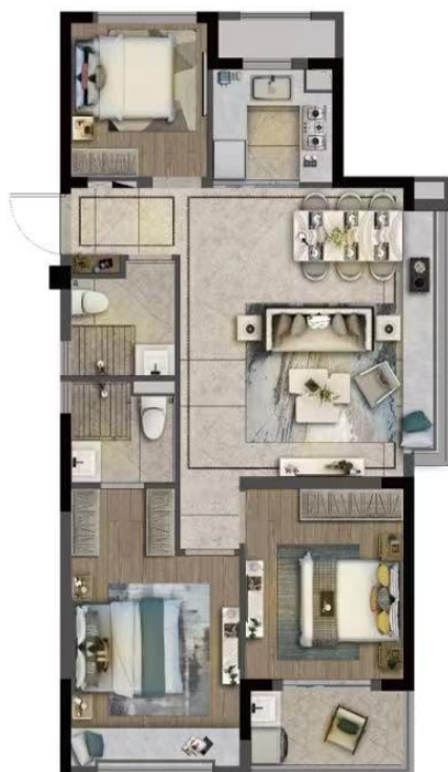
· 装修建议图 ·