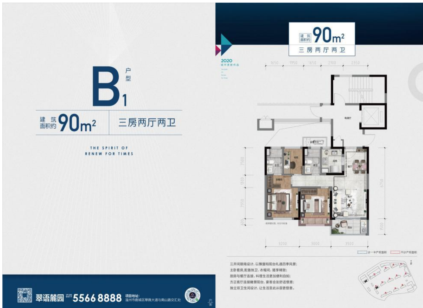
90 (B1) 户型