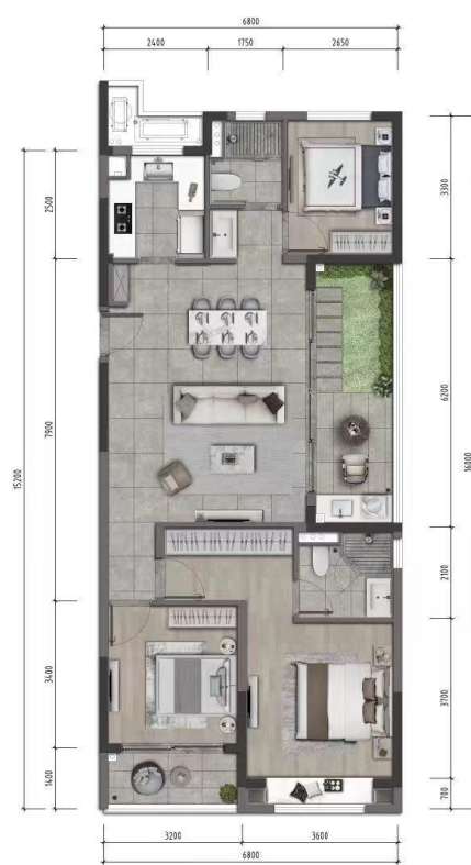
H' (120) 户型