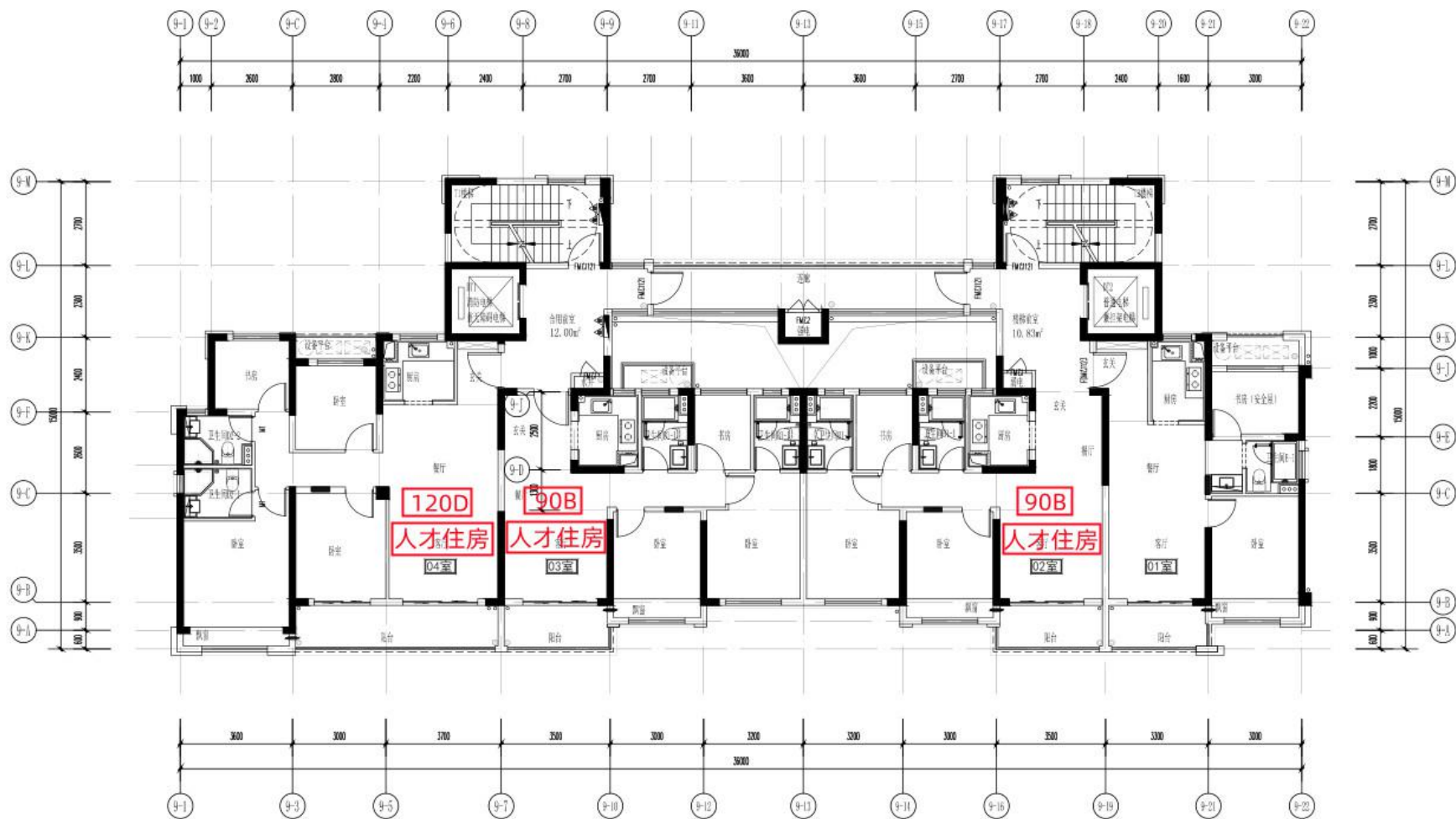
9#楼五层~二十五层平面图